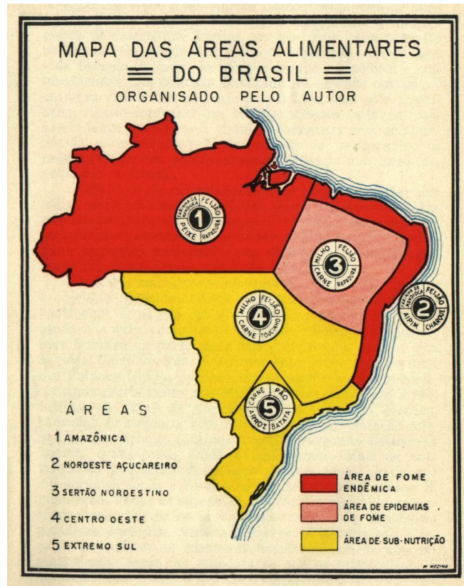
Figura 1: Mapa das áreas alimentares do Brasil

Fonte: Castro, 2008 (Elaborado por Josué de Castro, 1946).